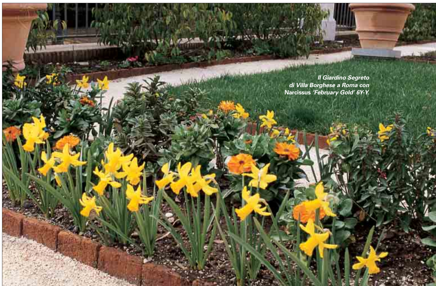
Il Giardino Segreto di Villa Borghese a Roma con Narcissus 'February Gold' 6Y-Y.