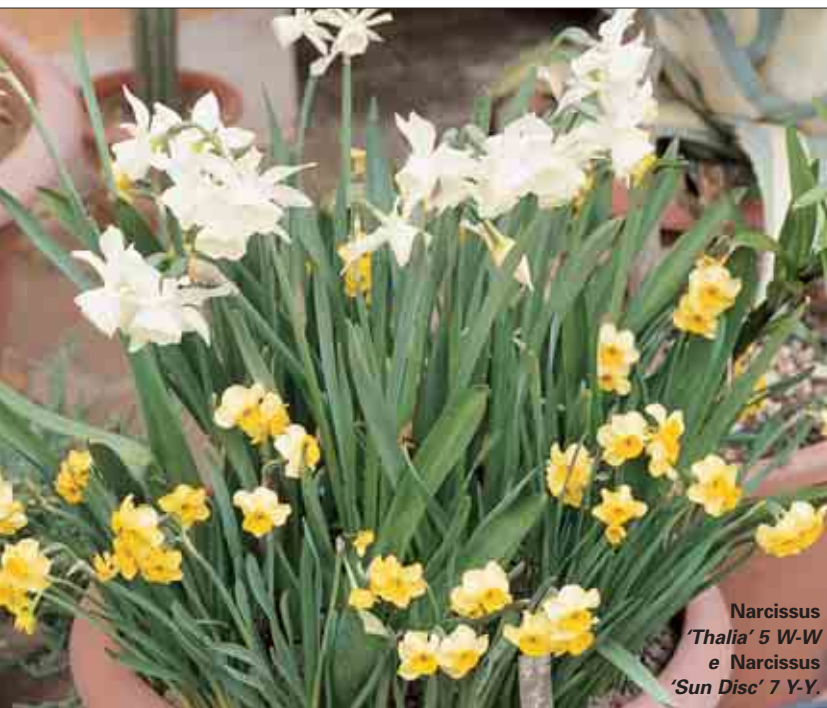
Narcissus 'Thalia' 5 W-W e Narcissus 'Sun Disc' 7 Y-Y.

piante che coprono tali zone con il loro fogliame o con vistosi fiori. Per rimanere nel campo delle bulbose, è possibile usare a questo scopo molti tipi di Allium , Anemone coronaria , Camassia , Hyacinthoides , Lilium , Ranunculus , Triteleia .