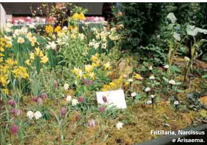
Fritillaria, Narcissus e Arisaema.