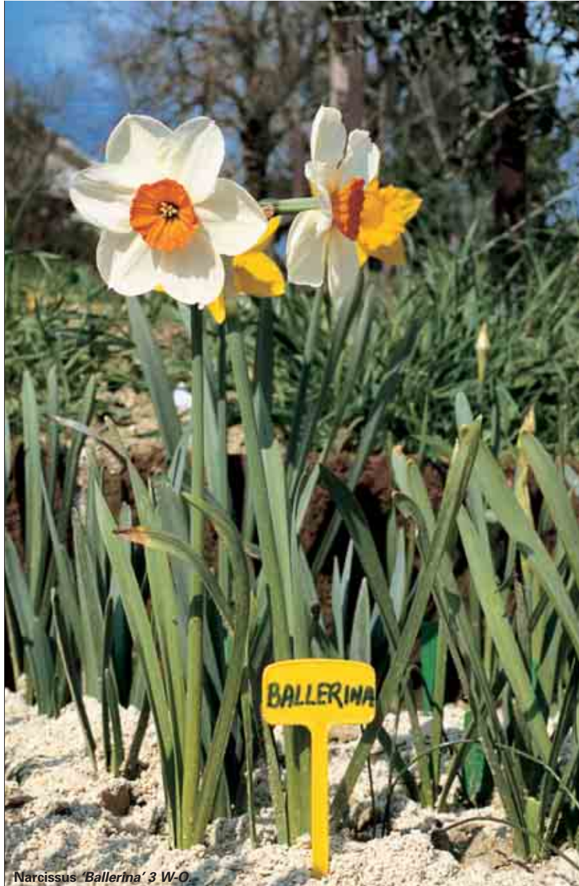
Narcissus 'Ballerina' 3 W-O.

varietà precoci verso il centro dello spazio a disposizione e più tardive verso l'esterno. Questo perché risulta piacevole guardare piante già fiorite attraverso il fogliame in sviluppo. Si consiglia di prestare molta attenzione alla scelta delle varietà, usando anche quelle molto profumate seppure frequentemente meno vistose nei singoli fiori.