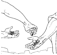
ὁ μισθός (τοῦ μισθοῦ)