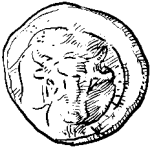
ὁ ὀβολός (τοῦ ὀβολοῦ)

Ὁ οὖν Δικαιοπόλις προσελθὼν ἔκοψε 230 τὴν θύραν, ἀλλ' οὐδεὶς ἦλθεν. Ἐπεὶ δ' αὖθις ἔκοψεν, δοῦλός τις ἐξελθὼν, «βάλλ' ἐς κόρακας,» ἔφη· «τίς ὦν σὺ κόπτεις τὴν θύραν;» Ὁ δὲ Δικαιοπόλις· «Ἄλλ', ὦ δαιμόνιε, ἐγὼ εἰμι Δικαιοπόλις· τὸν δὲ 235 παῖδα κομίζω παρὰ τὸν σὸν δεσπότην· τυφλὸς γὰρ γέγονεν.» Ὁ δὲ δοῦλος· «Ἄλλ' οὐ σχολή αὐτῷ.» Ὁ δὲ Δικαιοπόλις· «Ἄλλ' ὅμως κάλει αὐτόν· δεινὰ γὰρ ἔπαθεν ὁ παῖς· ἀλλὰ μένε, ὦ φίλε.» Καὶ 240 οὕτως εἰπὼν δύο ὀβολοὺς τῷ δούλῳ παρέσχεν. Ὁ δέ· «Μένετε οὖν ἐνταῦθα. Ἐγὼ γὰρ τὸν δεσπότην καλῶ, εἴ πως ἐθέλει ὑμᾶς δέχεσθαι.»