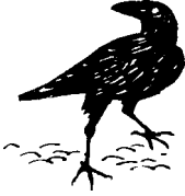
ὁ κόραξ (τοῦ κόρακος)