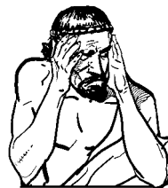
ὁ Δ. λυπεῖται

ὁ πένης (τοῦ πένητος) « πλούσιος, ἀφνειός