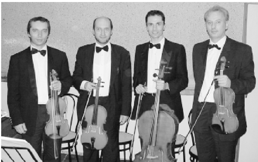
Il quartetto d'archi dell'Orchestra Filarmonia Veneta "G.F. Malipiero"