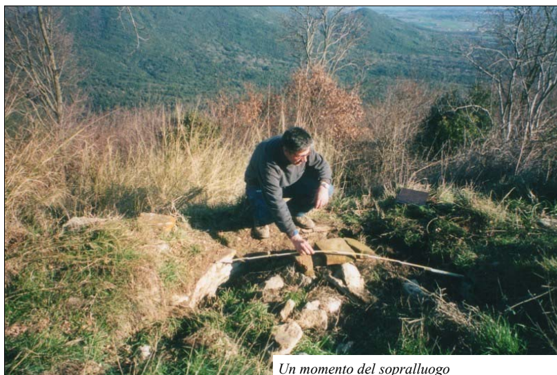
Un momento del sopralluogo

La cima di Monte Santo, stretta e allungata, non è molto ampia. Non sembra adatta a un insediamento vero e proprio. Sulla estremità a nord-est rinveniamo una grossa lastra di marmo lavorato, tegole romane e laterizi. Individuiamo una struttura semicircolare in mattoni. I resti di muri in pietra sono troppo sottili per fornire una difesa efficace; piuttosto potrebbero forse appartenere a un eremo, in coerenza con il toponimo. Tutt'intorno non troviamo tracce di strutture difensive, elemento che non smentisce