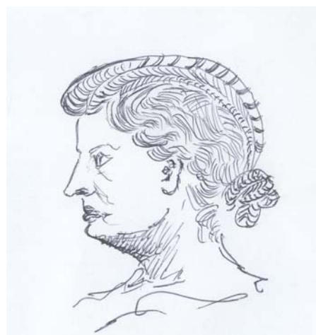
Livia moglie di Augusto

fogge scelga quella più adatta, e per consiglio si rivolga allo specchio. Un viso lungo vuole soltanto la scriminatura sulla fronte sgombra priva d'ornamenti; così si pettinava Laodomia. Viso rotondo esige che i capelli siano raccolti in alto, onde le orecchie rimangono scoperte. Un altro viso vorrà le chiome sciolte sulle spalle: così le sciogli tu, Feba? sull'una spalla o l'altra quando impugni la tua lira d'argento e alzi il canto. Li porti un'altra raccolti come Diana quando succinta insegue nella selva le fiere spaventate. A questa ancora conven-