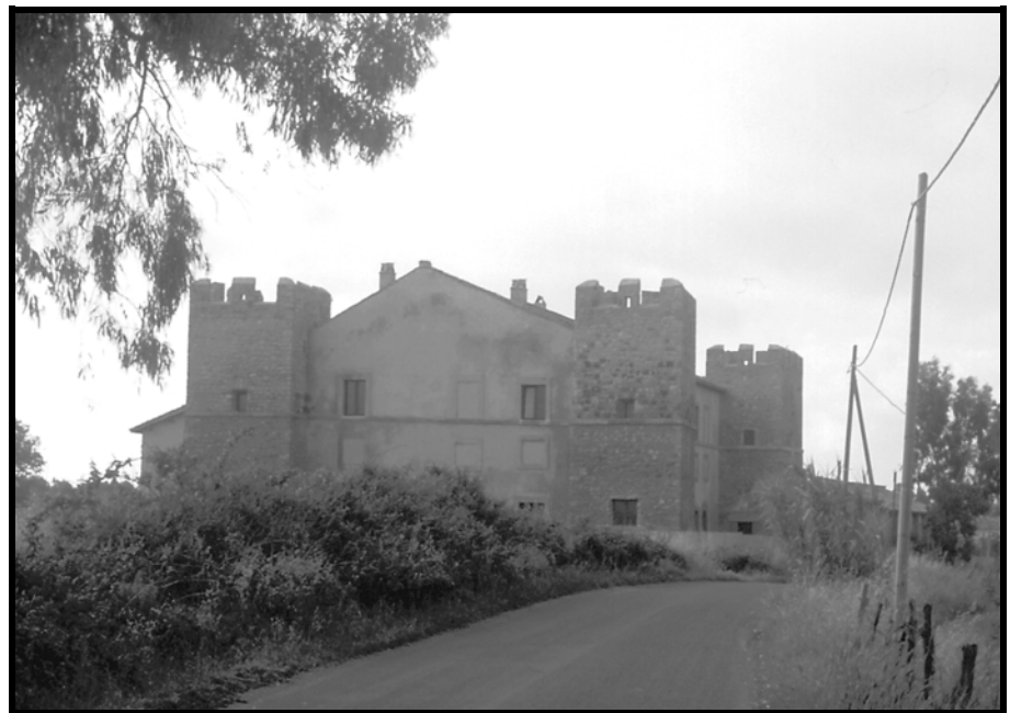
Il Castellaccio dei Monteroni

L'intervento dell'Associazione rimise in moto l'interesse per il monumento.