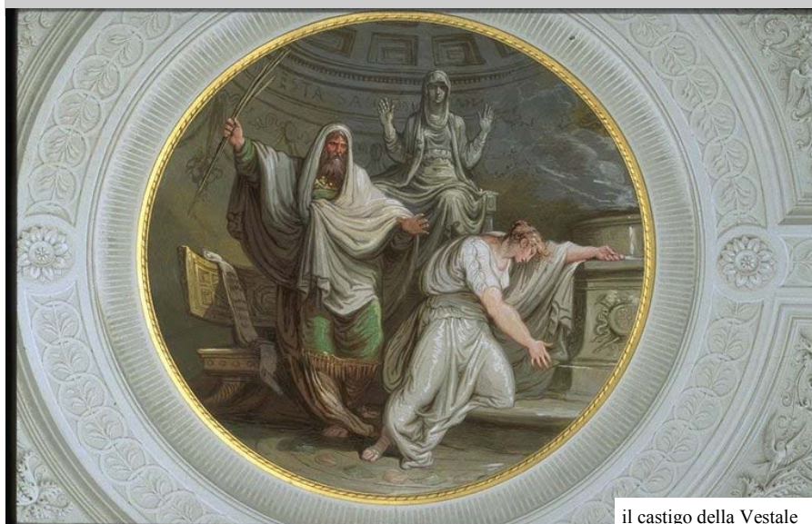
il castigo della Vestale