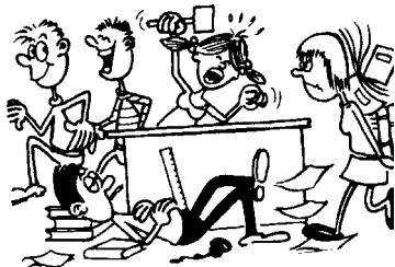
La redazione del Giornalino