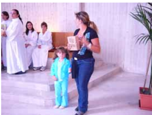
Nelle foto i vincitori del sorteggio a sorpresa