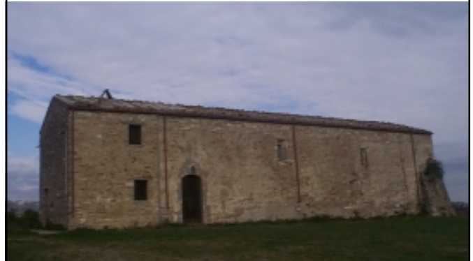
Chiesa di S. Pietro Sec. XII