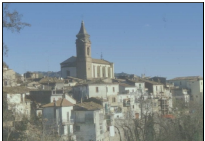
Panorama lato Sud