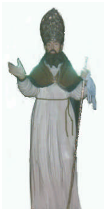
S. Antonio Abate

LE SUE GESTA DEBONO RAPPRESENTARE PER NOI LA LUCE DA NON SMARRIRE