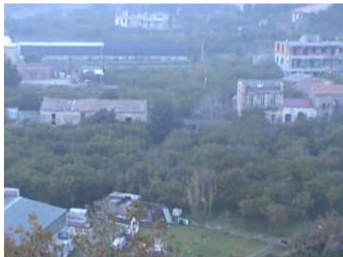
Veduta del terreno, in c.da Bruga, dove sorgerà l'oratorio

Con un pizzico di commozione ci disse: "Abbiamo acquistato un terreno in contrada Bruga, dove costruiremo l'oratorio". Un annuncio choc, in senso positivo, ovviamente. Bisognerebbe andare a scartabellare gli annali della parrocchia per trovare una notizia altrettanto importante. Parecchio del merito di quest'iniziativa è da ascrivere al nostro piccolo (solo in senso fisico, naturalmente)