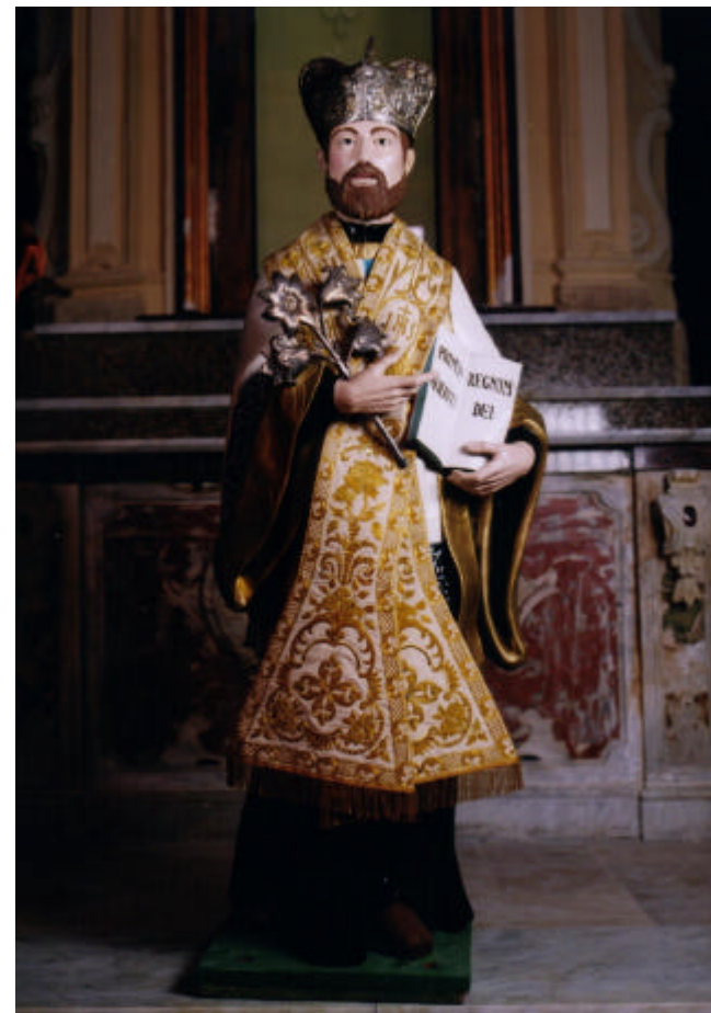
Il Patrono di S. Stefano Medio, Padre della Divina Provvidenza

S. Gaetano si è reso strumento dell'amore di Dio e chiede di vivere secondo i valori del Vangelo, gli unici veri valori che rendono la vita più umana e più bella da vivere.