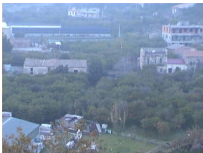
Veduta del terreno dove sorgerà la struttura