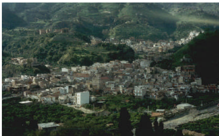
Un'immagine dall'alto di S. Stefano Medio

Ritornare è guardarsi dentro, riflettere, meditare, fare resoconti di vita vissuta, di progetti realizzati o di sconfitte mai dichiarate. A volte ripensando alle scelte