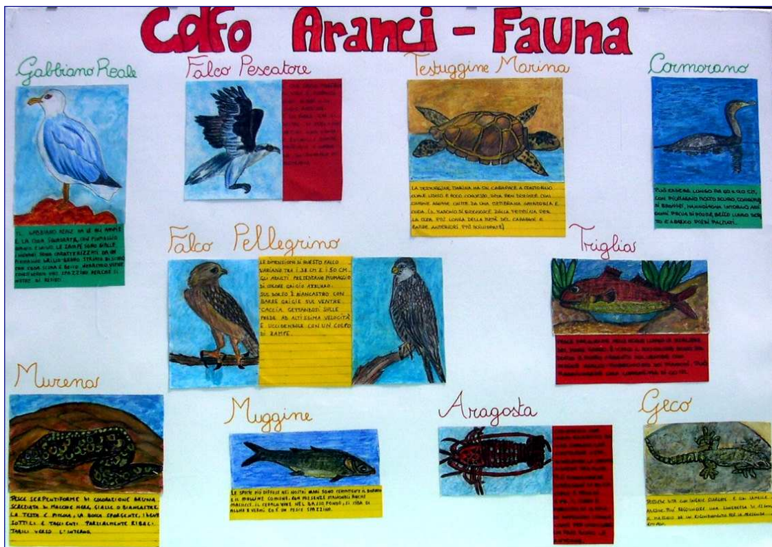
Figura 6 – Golfo Aranci, la fauna -- classe 2^A