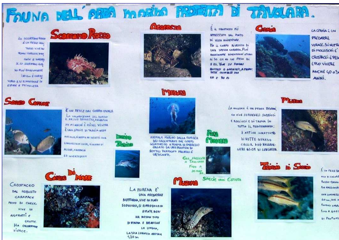
Figura 2 – Fauna dell'area marina protetta – classe 1 A