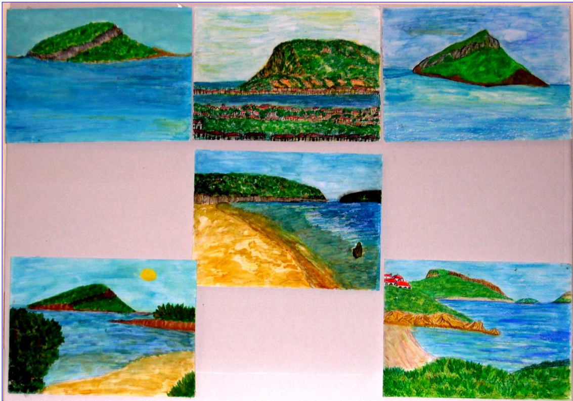
Figura 3 – Paesaggi artistici - classe 1^A