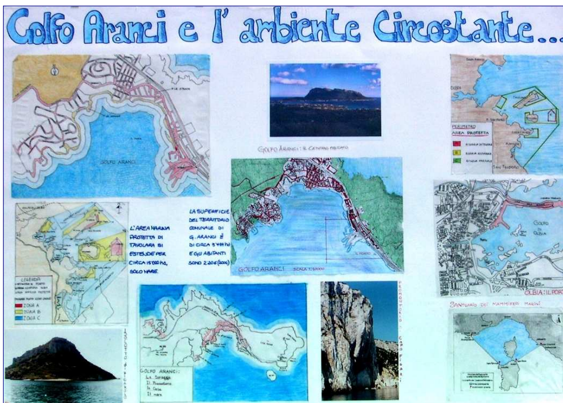
Figura 1- G. Aranci e l'ambiente circostante - classe 3 A