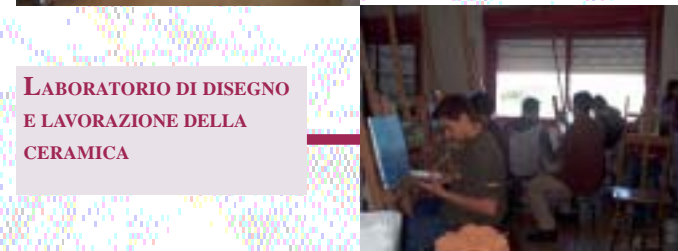
LABORATORIO DI DISEGNO E LAVORAZIONE DELLA CERAMICA