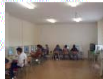
PRIMA AULA DI INFORMATICA