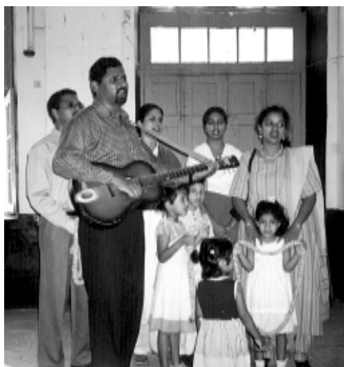
El Coro del MFC