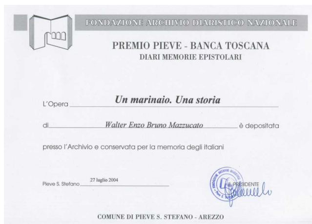
(a sn) Copertina del libro Un marinaio. Una storia. Diario di guerra dal 6 agosto 1940 al 15 dicembre 1944 di Walter E.B. Mazzucato edito per i tipi della Maggioli editore. (a dx) Certificato di deposito presso la Fondazione Archivio Diaristico Nazionale ad Arezzo.