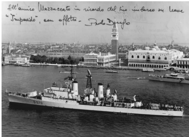
Nel Lorenall di Walter Mazzucato quello del periodo in servizio prestato all'Accademia Navale di Livorno dal 1967 al 1974 a firma dell'ammiraglio Sergio Agostinelli (a sn), l'imbarco sul Cassiopea (a dx in alto) e sull' Impavido (a dx in basso).