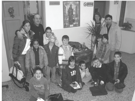
I bambini della 1^ Comunione con il presepe