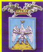
Provincia di L'Aquila