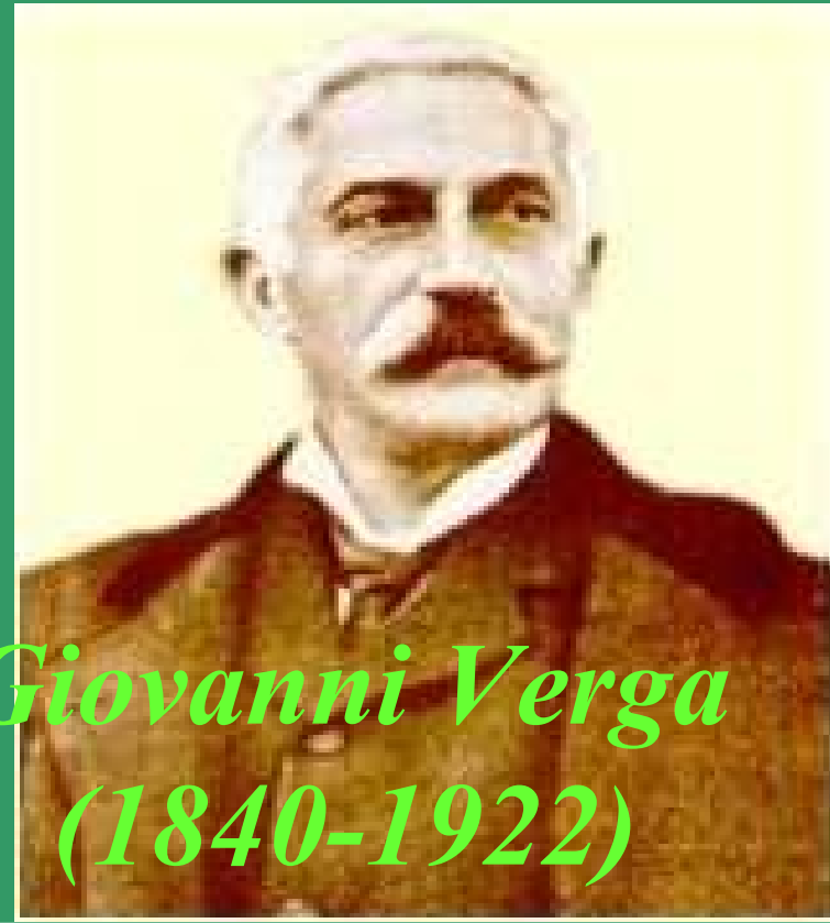
Giovanni Verga (1840-1922)