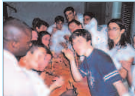
Spaghettona di fine stagione al Molo