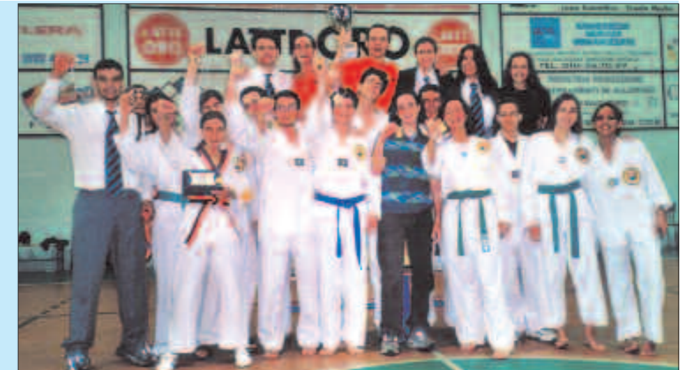
La squadra Agonistica ai campionati Regionali con la coppa per la 1ª Società classificata.