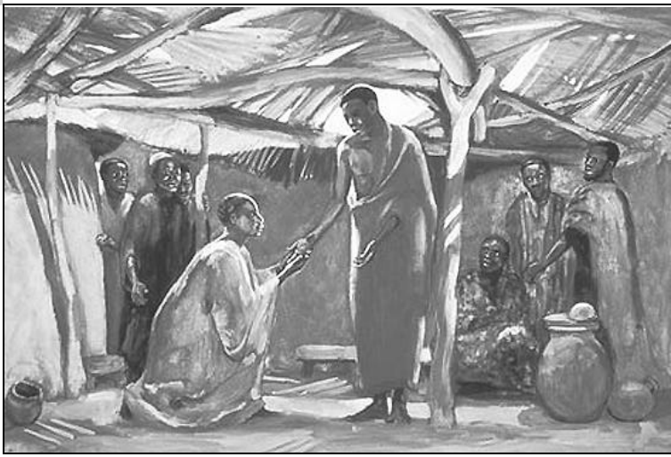
Tommaso riconosce Gesù. Rappresentazione africana.

Biadus cussus chi creint fintzas e chentza de ari biu.