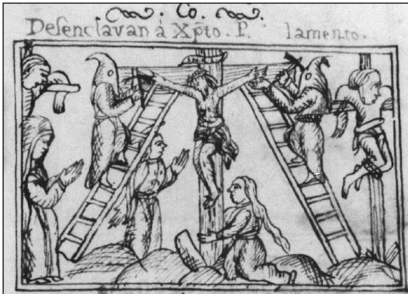
"Desenclavan à Christo P. Lamento" (Tav. 33, f. 107r) Illustrazioni dal Manoscritto 2 conservato nel Monastero di S. Chiara in Oristano.

Tiraindi imoi s'obilu de is peis suos. «Comenti funt bellus is peis de su missu de novas bonas, missu de paxi, chi betit salvatzioni». Cussus peis chi Maria Madallena at sciacuau cun is lambrigas suas e at istrèixiu cun is pilus suos; cussus peis arrosiaus cun ollu de fragus de su prus caru chi at iscantalitzau a Giudas po unu spreu aici mannu.