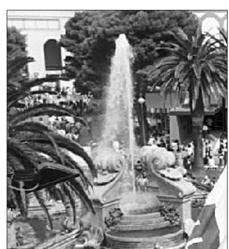
Fiera, il quartiere orientale

Se poi la si voleva vedere in tutta la sua persona, via, bisognava pagare l'ingresso alla cassa: «Presto, venite avanti, lo spettacolo del secolo sta per incominciare. Avanti, avanti, mezza lira al biglietto, avanti che c'è ancora posto. Non perdetevi il grande spettacolo di questo secolo», urlavano i banditori.